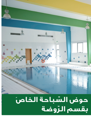
حوض السباحة الخاص بقسم الرّوضة