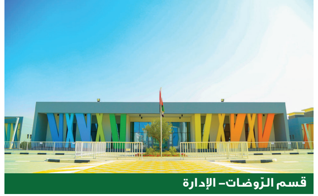
قسم الرّوضات- الإدارة