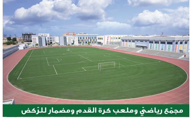
مجمّع رياضيّ وملعب كرة القدم ومضمار للركّض